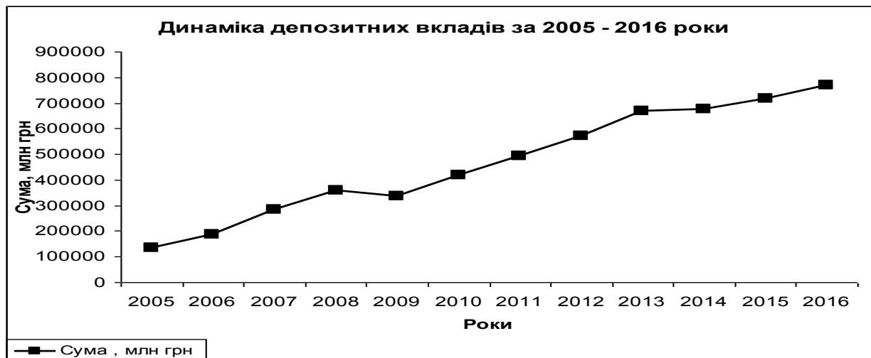
Рис. 2. Динаміка депозитів залучених банками за 2005–2016 роки (виконано автором на основі [4])

увагу не лише на кількісний показник, а й на якісний. Робота банку, в більшій мірі, має бути зорієнтована на ефективність депозитної політики, яка включає залучення найбільш вигідних потенційних клієнтів, тобто таких, які забезпечують більшу стабільність депозитних ресурсів і більш високий залишок на своєму рахунку; підтримку і утримання існуючих клієнтів; забезпечення ефективності кожної операції, пов'язаної з обслуговуванням клієнта; розробку індивідуальної цінової політики; розробку інформаційно-аналітичної системи підтримки прийняття рішень при формуванні депозитного портфеля; страхування вкладів населення.