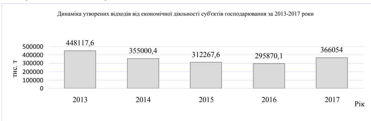
Рис. 2. Динаміка утворених відходів від економічної діяльності підприємств, організацій та домогосподарств

На рисунку 2 зображено динаміку утворених відходів від економічної діяльності суб'єктів господарювання за 2013–2017 роки.