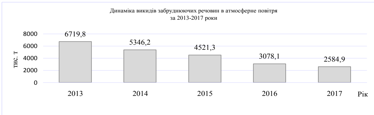
Рис. 1. Динаміка викидів забруднюючих речовин в атмосферне повітря