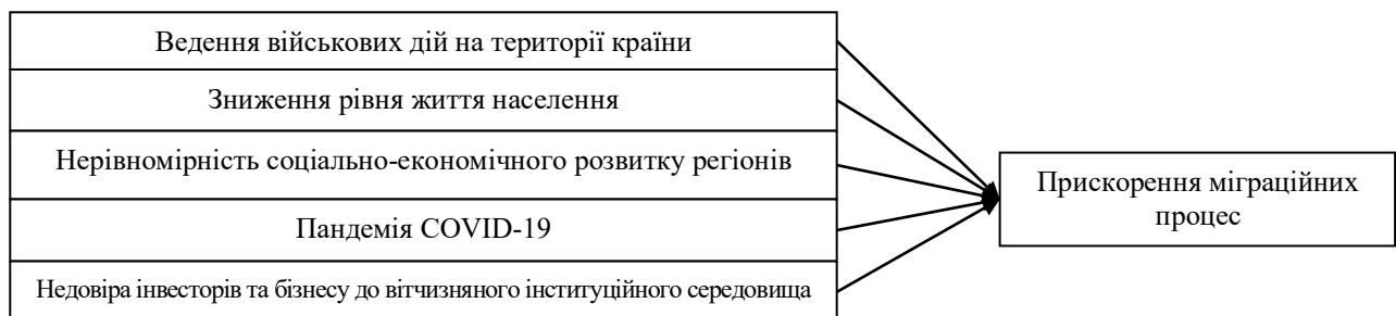
Рис. 3. Фактори, що впливають на прискорення міграційних процесів

Така кількість осіб суттєво вплинула на внутрішній ринок праці, а враховуючи складну ситуацію у сфері бізнесу, рівень безробіття значно зріс. Вважаємо, що на міграційні процеси найбільш активно вплинули наступні фактори (рис. 3).