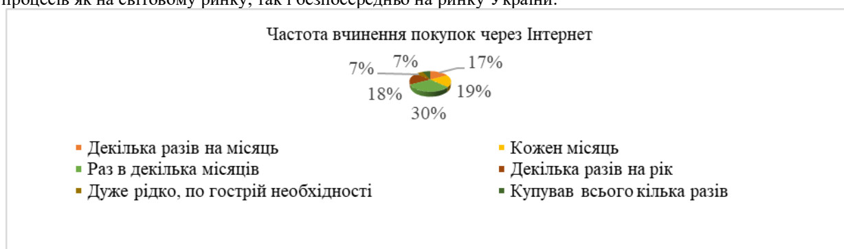
Рис. 3. Частота онлайн-замовлень в Україні, % [5]

Інновації є невід'ємною частиною електронної торгівлі. Імплементация соціальних медіа (Facebook, Instagram, Snapchat), системи онлайн-платежів (Apple Pay, PayPal, Stripe і Google Wallet), а також мобільних додатків (Uber, Nike, The New York Times, il Molino, Domino's, Ecolines, Нова Пошта) в електронну торгівлю оптимізують процес як для продавців, так і для покупців, подвоюючи обсяги купівлі-продажів. Використання таких новітніх інструментів, як чат-боти, голосовий помічник і технології віртуальної реальності (3D-сайту) формують нові форми комунікації між продавцем та покупцем, а також моделі бізнес-процесів як на світовому ринку, так і безпосередньо на ринку України.