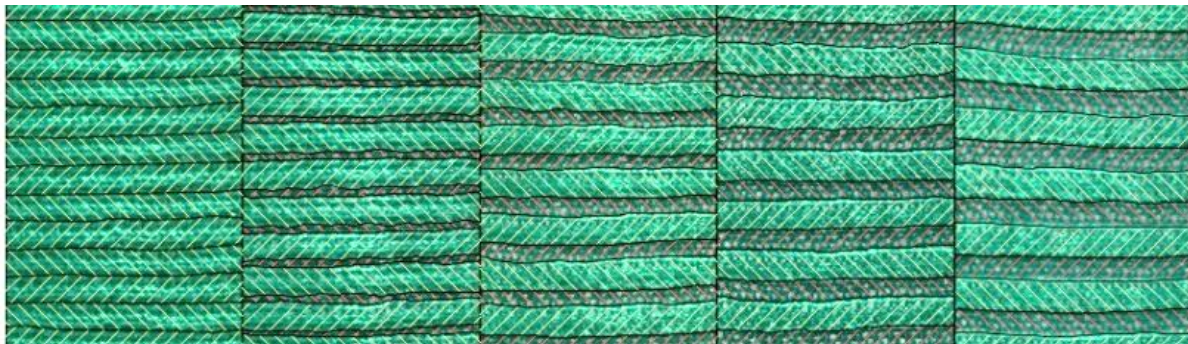
Рис. 3. Вивчення характеру перерозподілу матеріалу зразка трикотажу всередині окремого рапорту у процесі розтягу вздовж петельного ряду

На рис. 3 наведено один з етапів обробки зображень, на якому було визначено середні значення досліджуваних параметрів Шр , Ск , Sk .