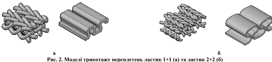
Рис. 2. Моделі трикотажу переплетень ластик 1+1 (а) та ластик 2+2 (б)

Вимоги до рівня деталізації тривимірної моделі структури трикотажу формуються відповідно до мети створення цієї моделі та сфери її майбутнього застосування. Для моделювання таких споживних характеристик як теплозахисні властивості, тиск одягу на тіло людини, розтяжність, пружність та деяких інших, доцільно використовувати моделі трикотажу, що не містять деталізації на рівні ниток (так звані поверхневі моделі). Під поверхневими моделями можна розуміти моделі трикотажу, що повторюють геометрію його поверхні без деталізації на рівні ниток. На рис. 2 наведено тривимірні моделі трикотажу переплетень ластик 1+1 (рис. 2 а) та ластик 2+2 (рис. 2 б) з деталізацією на рівні ниток та без такої деталізації.