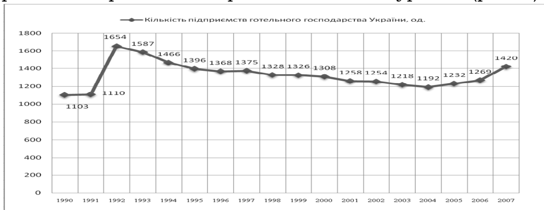
Рис. 1. Динаміка кількості підприємств готельного господарства України за 1990 – 2007 рр. [9]

Результати аналізу тенденцій зміни кількості підприємств готельного господарства України за 1990-2007 роки засвідчили, що динаміка кількості підприємств гостинності, починаючи з 1990 по 1992 рік, мала стрімку тенденцію до зростання. Зокрема, в 1992 році їх кількість зросла на 544 одиниці, або на 49,01%, порівняно з попереднім 1991 роком. Таке збільшення кількості підприємств сфери гостинності було зумовлене в основному зростанням загального інтересу до України зі сторони інвесторів та іноземних туристів (рис. 1).