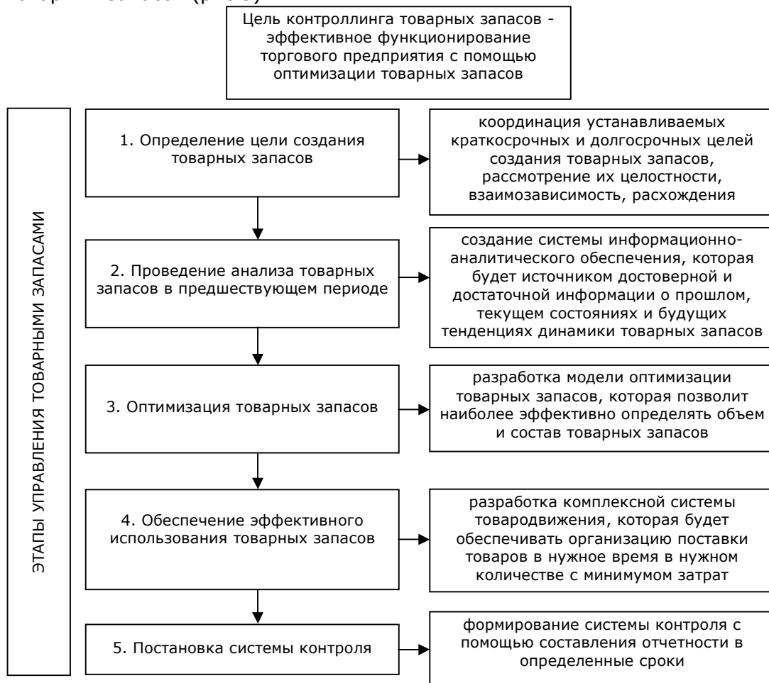
Рис. 3. Модель контроллинга товарных запасов

Исходя из вышеизложенного была сформирована модель контроллинга товарных запасов (рис.3).