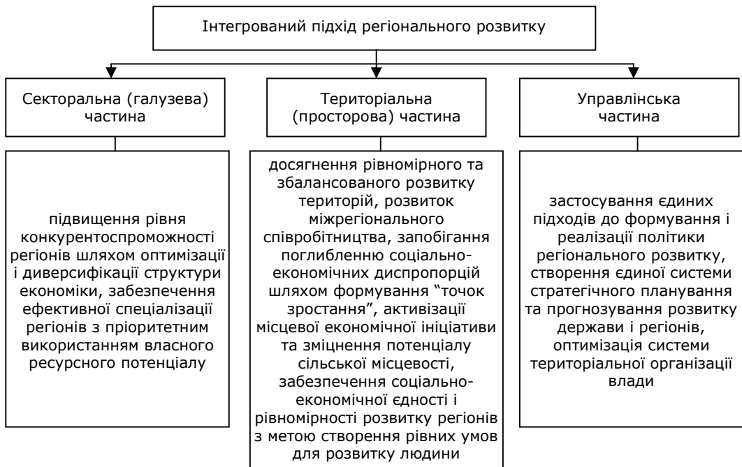
Рис. 1. Структура інтегрованого підходу регіонального розвитку України [1]

В основу Державної стратегії регіонального розвитку покладено інтегрований підхід, який передбачає поєднання таких складових частин: секторальної, територіальної, управлінської (рис. 1).