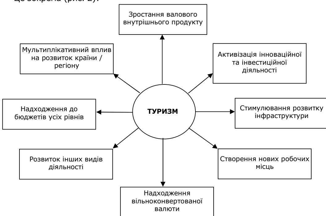
Рис. 2. Вплив розвитку туризму на економіку країни / регіону

На підтвердження цього наводимо декілька цифр розвитку туризму в світі та його вплив на економіку.