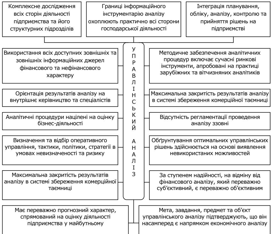
Рис. 1. Характеристика та концептуальні засади управлінського аналізу*

розглядатися як особлива галузь економічної науки та як одна з функцій практики управління організацією, метою якої є обробка та надання інформації у систему прийняття управлінських рішень в організації [5, с. 12]. М. А. Вахрушина розглядає управлінський аналіз як розділ економічного аналізу та складову частину управлінського обліку [4, с. 21].