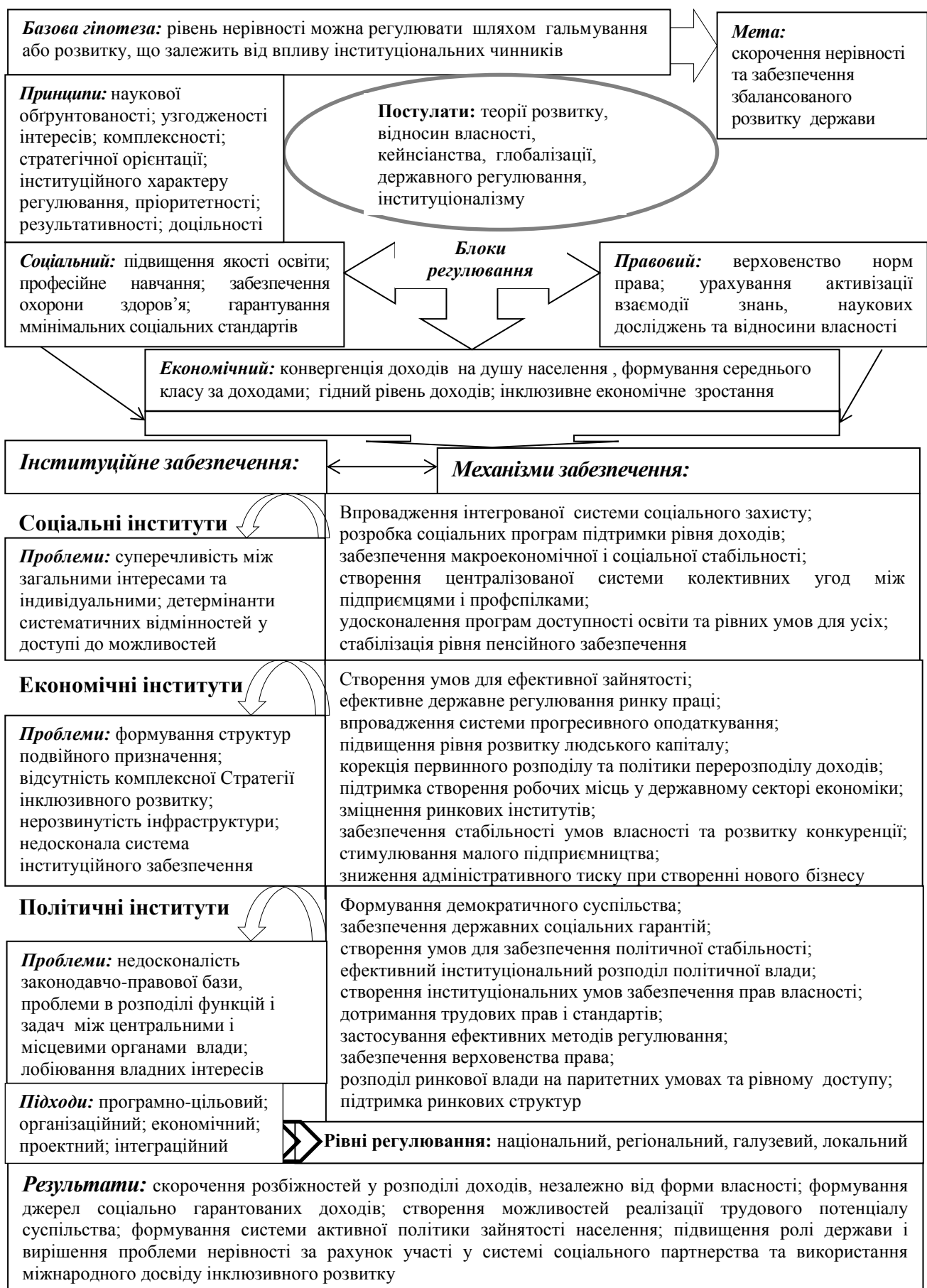
Рис. 2. Діалектично-логічні основи системи скорочення соціально-економічної нерівності в Україні