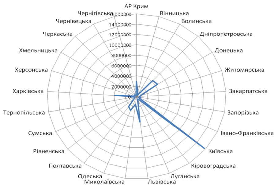
Рис. 4. Інвестиції в рекреаційно-побутову складову рекреаційної інфраструктури за регіонами України у 2012 році