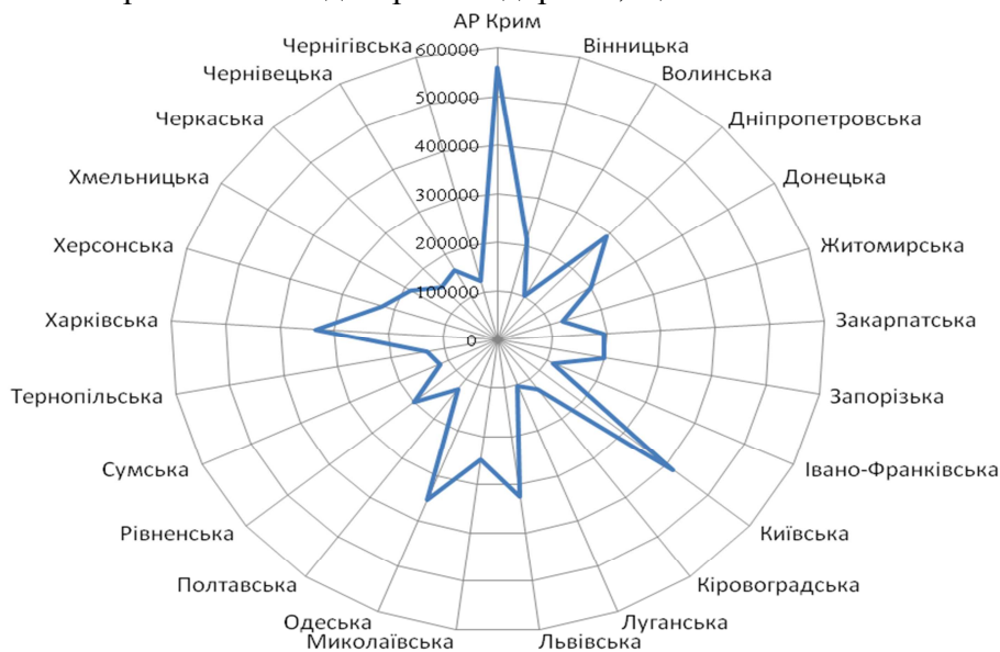
Рис. 5. Інвестиції в рекреаційно-виробничу складову рекреаційної інфраструктури за регіонами України у 2012 році

Від розвитку рекреаційної інфраструктури залежить асортимент та доступність рекреаційних послуг, використання яких широкими верствами населення забезпечує належний рівень збереження та відтворення здоров'я, що визначає якість життя.