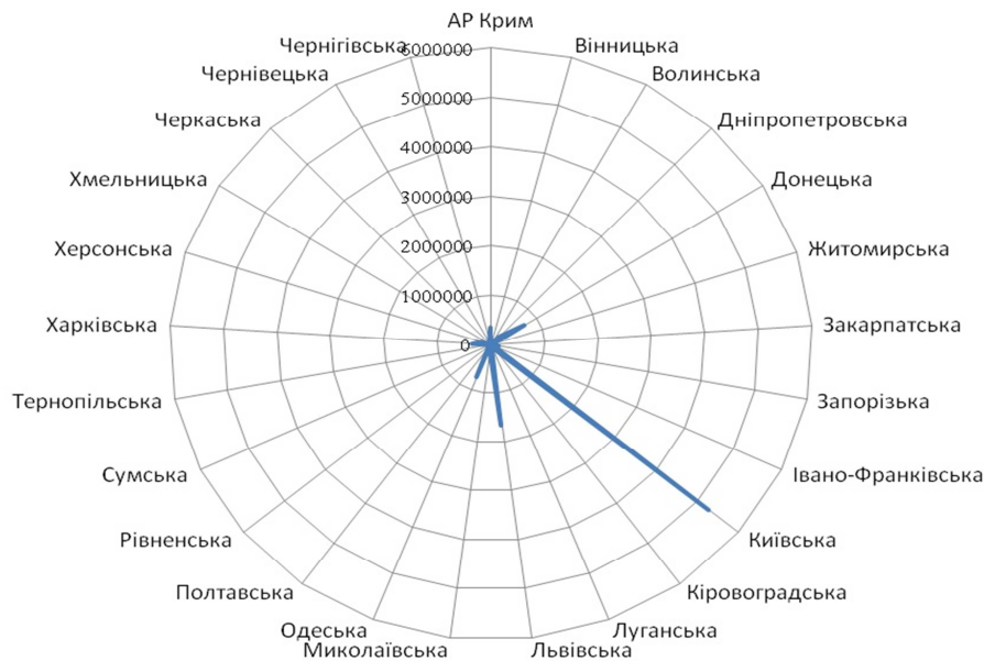
Рис. 3. Інвестиції в культурно-історичну складову рекреаційної інфраструктури за регіонами України у 2012 році

Обсяг інвестицій у культурно-історичну та рекреаційно-побутову складові рекреаційної інфраструктури показує, що найбільше інвестування також отримує м. Київ та Київська область (рис. 3, 4).