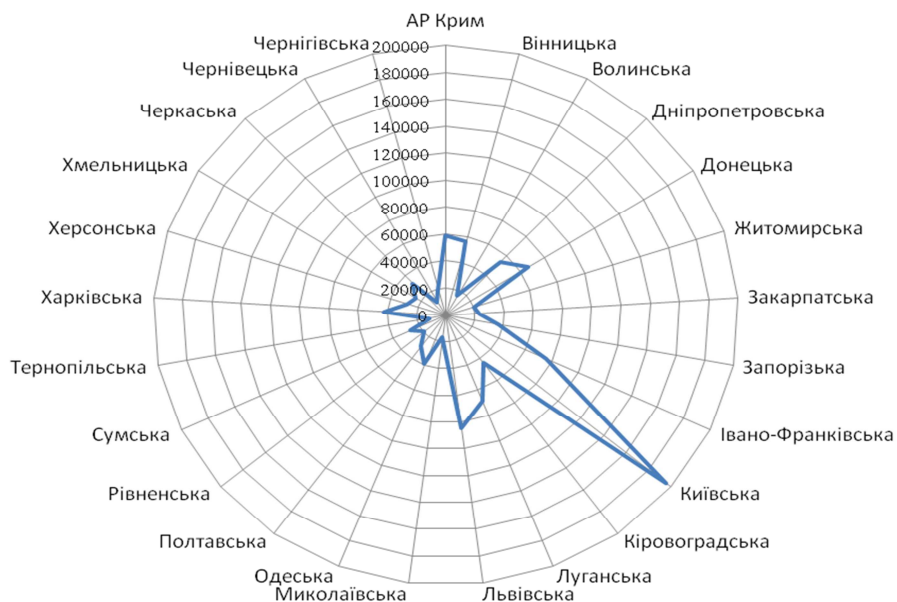
Рис. 2. Інвестиції у функціонально-спеціалізовану складову рекреаційної інфраструктури за регіонами України у 2012 році

Аналіз капітальних вкладень у регіональному розрізі за складовими рекреаційної інфраструктури показує, що їх обсяг у розвиток функціонально-спеціалізованої складової рекреаційної інфраструктури характеризується нерівномірністю, а саме: найбільший обсяг спрямовується на м. Київ та Київську область (рис. 2).