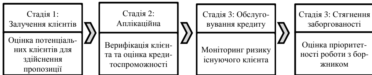
Рис. 1. Стадії взаємодії між кредитором і позичальником

На першій стадії кредитор здійснює оцінювання потенційних клієнтів для здійснення їм пропозиції кредитного продукту. Скорингова оцінка на цій стадії має відображати пріоритетність або значимість клієнта для банку. Оцінювання може здійснюватися на існуючій базі клієнтів. У випадку відсутності бази даних ця стадія також відсутня. Наступною є стадія розгляду аплікації. На ній вирішуються завдання верифікації позичальника та оцінювання його кредитоспроможності. На стадії існування кредитних відносин, яка слідує за аплікаційною, актуальним є завдання моніторингу клієнта на предмет можливої зміни його кредитоспроможності. Нарешті, у тому випадку, коли позичальник вийшов у прострочення, настає стадія стягнення. На цій стадії актуальними є завдання пріоритетзації колекторських зусиль. На кожній із цих стадій може бути ефективно використаний скоринговий підхід, імплементація якого розглядається нижче.