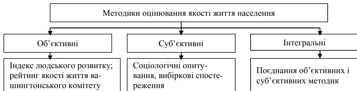
Рис. 1. Класифікація методик оцінювання рівня та якості життя населення

Виклад основного матеріалу. Численні фахівці розробляють власні та певні уніфіковані методики оцінювання рівня та якості життя населення (рис. 1) [3; 5; 6; 10].