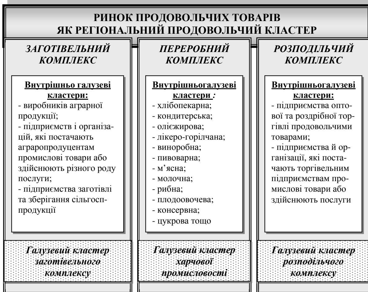
Рис. 1. Ринок продовольчих товарів як регіональний продовольчий кластер

Продукція, яка використовується населенням і призначена в першу чергу для особистого та суспільного споживання, визначається як споживчі товари. Найбільшу частку у структурі споживчих товарів останнім часом становлять харчові продукти. Відсутність зростання доходів більшої частини населення, викликане економічною та політичною нестабільністю у країні, що вплинуло на зміну структури виробництва споживчих товарів, спрямованих насамперед на придбання продуктів харчування (рис. 1).