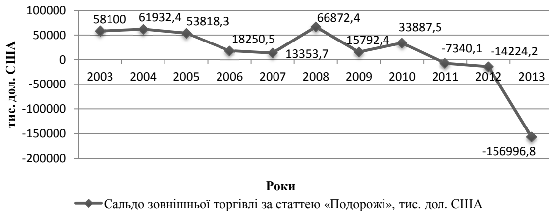
Рис. 2. Сальдо зовнішньої торгівлі України за статтею «Подорожі» у 2003–2013 рр., тис. дол США

Важливим напрямом стимулювання національної економіки повинен стати розвиток туризму в межах країни, який являє собою сукупність в'їзних та внутрішніх туристичних потоків. Разом з тим в'їзний туризм суттєвим чином позитивно впливає на формування дохідної частини державного бюджету та є вагомим джерелом валютних надходжень до економіки країни за рахунок туристичних витрат від іноземних та внутрішніх туристів.