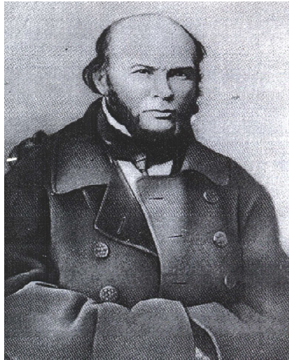
Фото 2. Н.И.Пирогов (1810-1881).