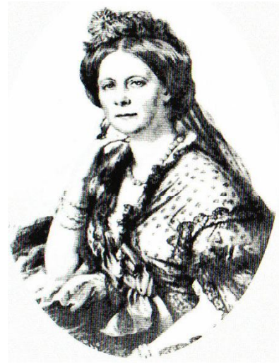
Фото 3. Великая княгиня Елена Павловна (1806-1883).

строй милосердия!" [4] - писала она. Однако "желание поступить в сестры милосердия встретило сильную оппозицию родных и знакомых..., так как жизнь девушек нашего звания проходила в выездах, занятиях музыкой, рисованием, домашними спектаклями, балами, на которых я, должна прямо признаться, танцевала с удовольствием", - вспоминала Екатерина Михайловна [4]. Поэтому поездка в Крым постоянно откладывалась. Е.М.Бакунина с возмущением писала: "...когда дочь Бакунина, который был губернатором в Петербурге, и внучка И.Я.Голенищева-Кутузова желает ходить за матросами, то странно, кажется, отказывать ей в этом" [4].