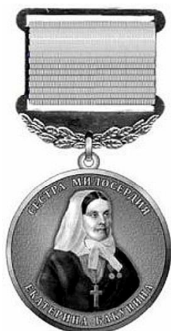
Фото 4. Медаль "Сестра милосердия Екатерина Бакунина". - 2011 г.