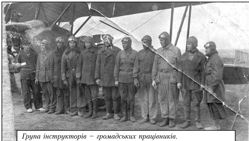
Група інструкторів – громадських працівників. Запорізький аероклуб. 1936 р.