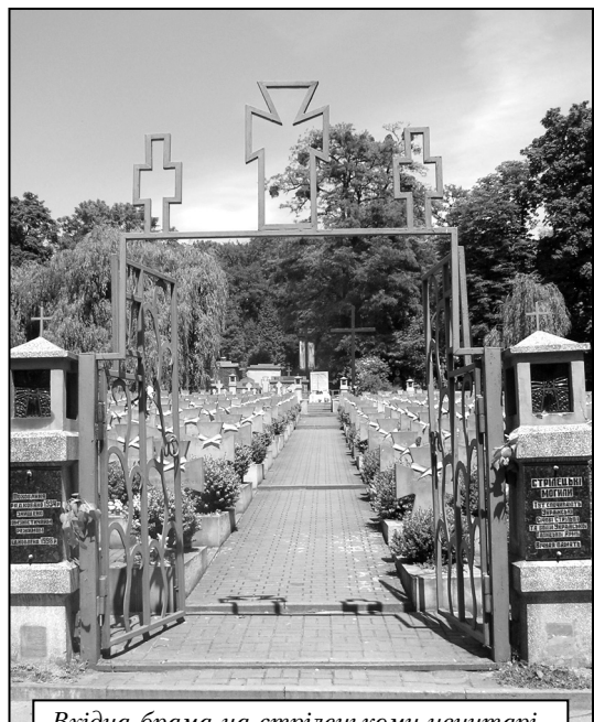
Вхідна брама на стрільцькому цвинтарі

На полях 38 та 38а у 1997–1999 рр., за проектом авторського колективу інституту «Укрзахідпроектреставрація» (керівник О. Петришин), відновлено військовий меморіал стрільців УГА, які загинули під час листопадових боїв за Львів у 1918 р. та в наступні роки під час українсько-польської війни. Тут поховані, здебільшого, Українські Стрільці, які померли від ран та пошестей у польських тюрмах у 1919–1920 рр. Цей військовий меморіал упорядкований ще у 1933 р. за