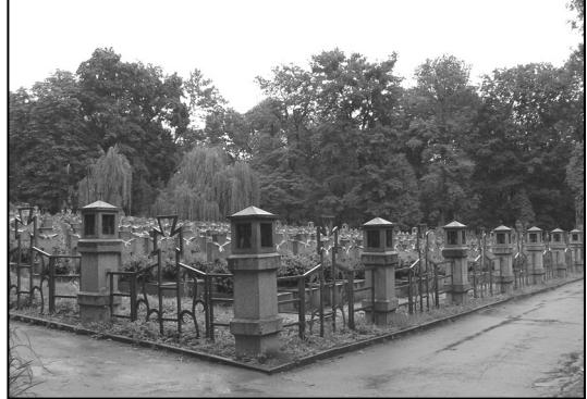
Стрільцький цвинтар, 1918 р. 1919–1920 рр.

На полях 38 та 38а у 1997–1999 рр., за проектом авторського колективу інституту «Укрзахідпроектреставрація» (керівник О. Петришин), відновлено військовий меморіал стрільців УГА, які загинули під час листопадових боїв за Львів у 1918 р. та в наступні роки під час українсько-польської війни. Тут поховані, здебільшого, Українські Стрільці, які померли від ран та пошестей у польських тюрмах у 1919–1920 рр. Цей військовий меморіал упорядкований ще у 1933 р. за