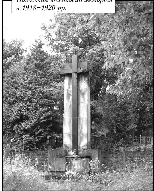
Польський військовий меморіал з 1918–1920 рр.

розміщено меморіал, який, після розширення у 1922 році, складався з 16-ти рядів могил, у яких було 375 поховань [17]. Пам'ятний обеліск загиблим воїнам на єврейському кладовищі запроєктував архітектор Вавжинець Дайчак близько 1919 р. [18].