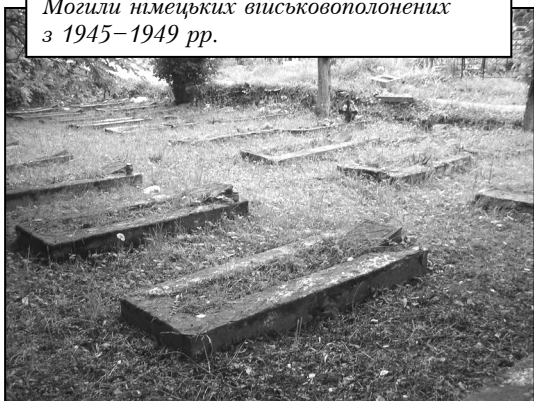
Могили німецьких військовополонених з 1945–1949 рр.

Протягом 1941–1945 рр. на частині Янівського цвинтаря, прилеглої до теперішньої вул. Т. Шевченка, ховали вояків гітлерівської армії. У 1941 р. на 6-му полі кладовища закладене окреме військове поховання для словаків, яке, як і всі інші військові поховання, було знищене на початку 1970-х рр. Збереглася лише напівзруйнована бетонна стелла з двораменним хрестом та написом: «Життя за Віру, за Свободу народу, по жертвували для Перемоги. Тут лежать герої словацької армії, які загинули під час війни, коли вирішувалася доля словацької незалежності і свободи». Під цим написом перелічені 17 загиблих словацьких вояків.