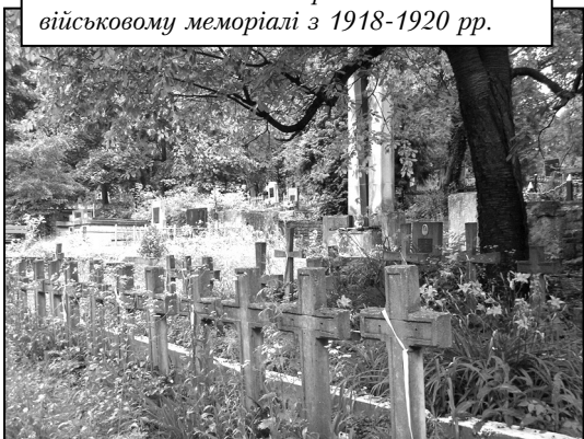
Могили польських ветеранів на військовому меморіалі з 1918-1920 рр.

дям, що стали жертвами терору НКВД у червні 1941 р.