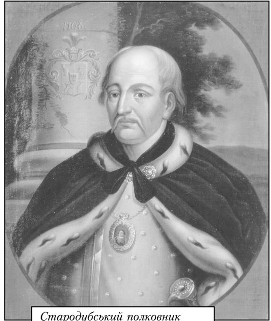
Стародубський полковник Іван Скоропадський

У червні відбувся черговий раунд переговорів, і в результаті було підготовано спільну резолюцію: «...мир, який робиться між Україною та Московщиною, повинен ґрунтуватися на міцних демократичних основах, які в самім зародку усуватимуть можливі в будуччині причини непорозуміння, і що визначіння кордонів є передумовою не тільки теперішніх, але й майбутніх взаємних відносин між обома державами, обидві делегації годяться відкинути при визначенні кордонів усяку думку про захвати й насильства» [3, 117]. Українська делегація запропонувала такі кордони між обома державами, які засвідчували історичну належність Стародубщини до України. Кордон починався від Вигоновського озера й далі йшов по лінії: в межах Мінської губернії річкою Шарою, далі на Любашево, Круговичі, Локтиші, Чепелі, Погост, на Уряччя, Пасіки, Слуцьк, Борову, Новий Степ; в межах Могилевської губернії: рікою Дніпром 4 версти вище від Жлобина, далі на Рачин, Шепетовичі, потім рікою Сожем до річки Бесіди, долі на Святське; звідси по