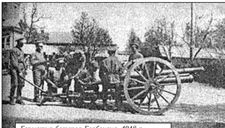
Гарматна батарея Болбочана. 1918 р.