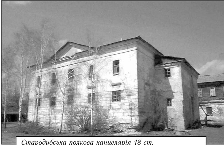
Стародубська полкова канцелярія 18 ст.

дубщини. Постановою Президії ЦВК СРСР від 16 жовтня того року про врегулювання кордонів УРСР було передано Семенівську волость Новозибківського повіту Гомельської губернії, а також село Зноб Трубчевської волості Почепського повіту Брянської губернії. Проте вже через тиждень Президія ЦВК СРСР ухвалила залишити це село в межах РСФРР [1, 156–159]. У 1926 році після передачі Гомеля Білорусії Стародуб-