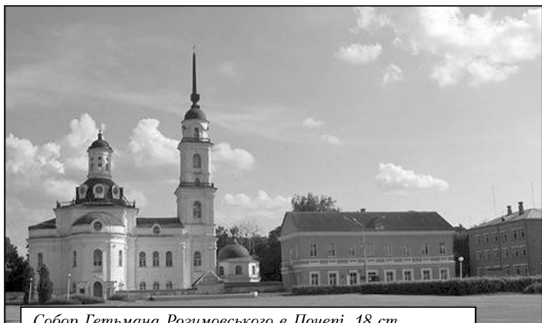
Собор Гетьмана Розумовського в Почепі. 18 ст.

У 1925 році до складу радянської України повернувся невеликий скрайок Старо-