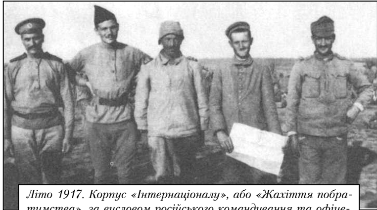
Літо 1917. Корпус «Інтернаціоналу», або «Жахіття побратимства», за висловом російського командування та офіцерів АСМ. Солдати на знімку (зліва направо) — це: росіянин, бельгійець, турок, німець і австрієць

Керенський приїздив також в Озерну. Марсель Тірі згадував, як очільник революційної Росії агітував запальними промовами російських солдатів за продовження боротьби, вихваляв мужність бельгійців та АСМ