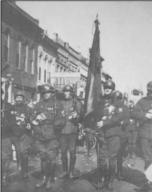
Каліфорнія, травень 1918. У Сан-Франциско бельгійців АСМ вішнують квітами; у Сакраменто дорога «бельгійських героїв» встелена килимом із квітів