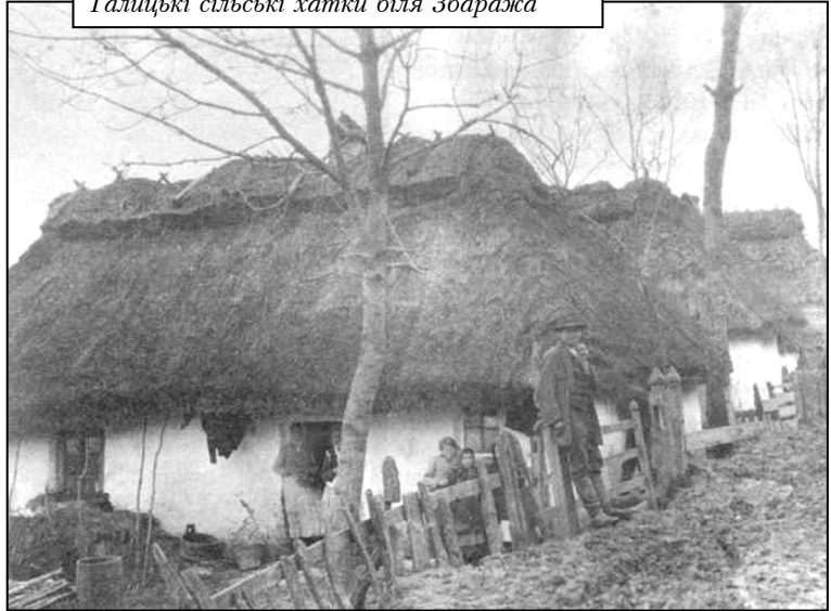
Галицькі сільські хатки біля Збаражя

важно на цій війні. Батарея №2 повертала-ся на свої позиції, під сильною зливою, під час якої загрузла і поламався один із панцерників. Лише при допомозі російських коней, які витягли бронемобілі з багна, бельгійці повернулися до посту в Ігровиці. Так відбулося перше бойове хрещення АСМ дивізіону в Галичині. Саме під час першого бойового хрещення у бельгійців виник дещо зневажливо – гоноровий бойовий клич: «On va lenr couper la tete!» – «Постинаймо їм голови». Це на адресу австрійців.