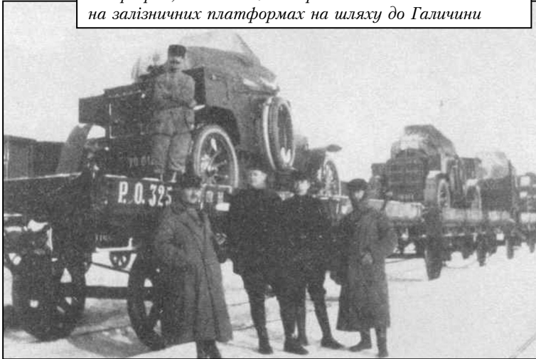
Петроград, 10 січня 1916. Бронемобілі АСМ на залізничних платформах на шляху до Галичини

російські можновладці схвально відреагували на цю ідею.