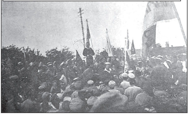
Українська матроська маніфестація у Севастополі, 1917 рік.

На Чорноморському флоті за час після Лютневої революції та створення УНР відбулися помітні зміни. Почалося перейменування нових кораблів. Так лінкор «Імператор Олександр Третий» став лінкором «Воля», а «Императрица Катерина Вторая» лінкором «Свободная Россия». Крейсер «Адмірал Нахимов» став називатися «Гетьман Богдан Хмельницький», есминець «Незаможний» став називатися «Незаможником», одному з есмінців було присвоєно ім'я «Гайдамак», з'явилися нові кораблі «Україна» і «Кубанець» [6, с. 118].