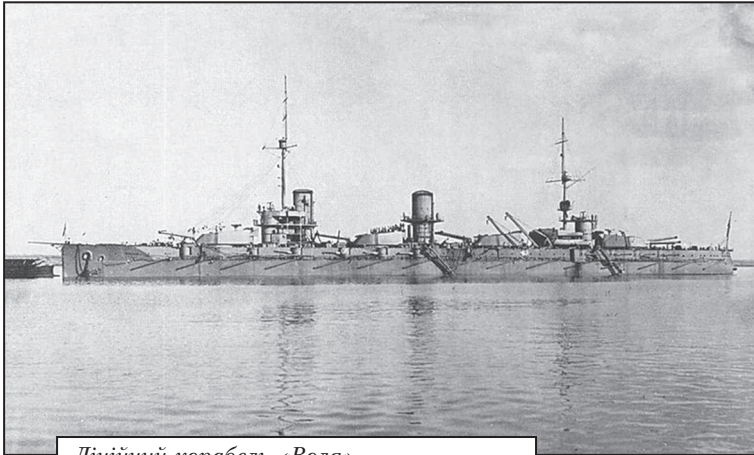
Лінійний корабель «Воля»

публіки». Згідно цього закону всі кораблі колишнього російського флоту на Чорному морі, як військові, так і транспортні та торговельні, проголошувались флотом Української Народної Республіки [17].