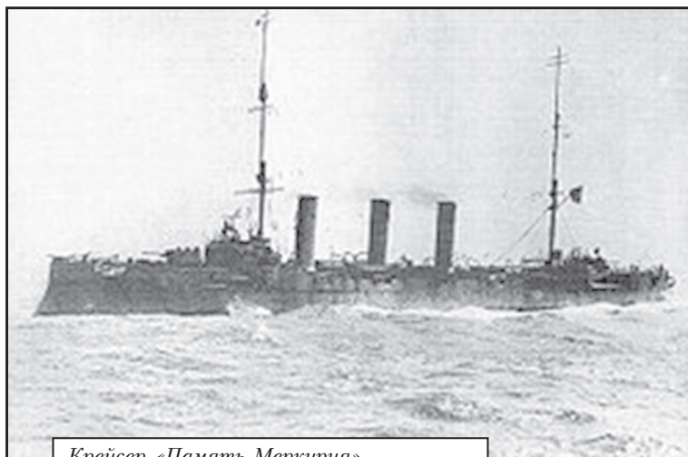
Крейсер «Память Меркурия»

У березні – квітні 1917 року були проведені збори моряків-українців, на яких була