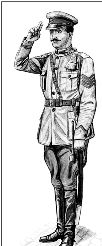
Вахмістр польського уланського полку у 1918 р.