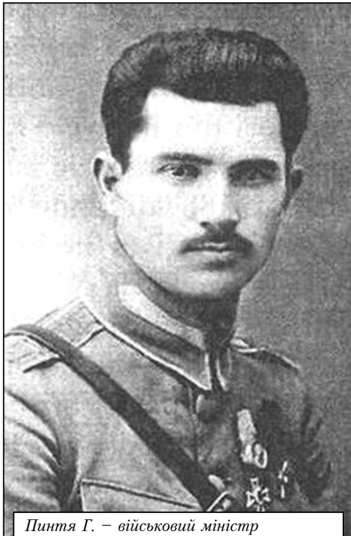
Пинтя Г. – військовий міністр Молдавської Демократичної Республіки

де перебував Курултай [6, 122]. Кримська Народна Республіка припинила своє існування.