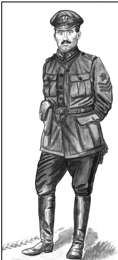
Унтер-офіцер 3-го Польського корпусу у 1918 р.

Частини корпусу не користувались військовим самоврядуванням, не мали комітетів, зберігали до революційну дисципліну.