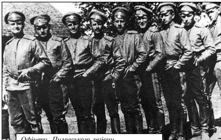
Офіцери Пулавського легіону

У ніч з 10(23) на 11(24) січня 1918 року вони були розбиті більшовицькими відділами. 12 (25) січня червоногвардійці зайняли Бахчисарай, а 14 січня за допомогою севастопольських матросів – Сімферополь,