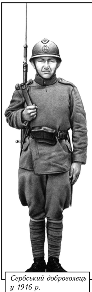
Сербський доброволець у 1916 р.

Але ця військова кампанія виявилася невдалою для російсько-румунських військ, які після двох місяців (вересень-жовтень 1916р.) жорстоких боїв, зазнали поразки і вимушені були відступити на російську територію. У ході цієї кампанії втрати 1-ї сербської добровольчої дивізії склали 755 загиблих, 6463 пораненими та 664 зниклими безвісті [15].