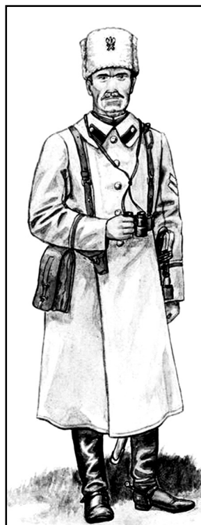
Підполковник артилерії Польського корпусу, 1918 р.

20 лютого 1918 року війська корпусу при підтримці німецьких військ та загонів Білоруської ради звільнили від більшовиків Мінськ.