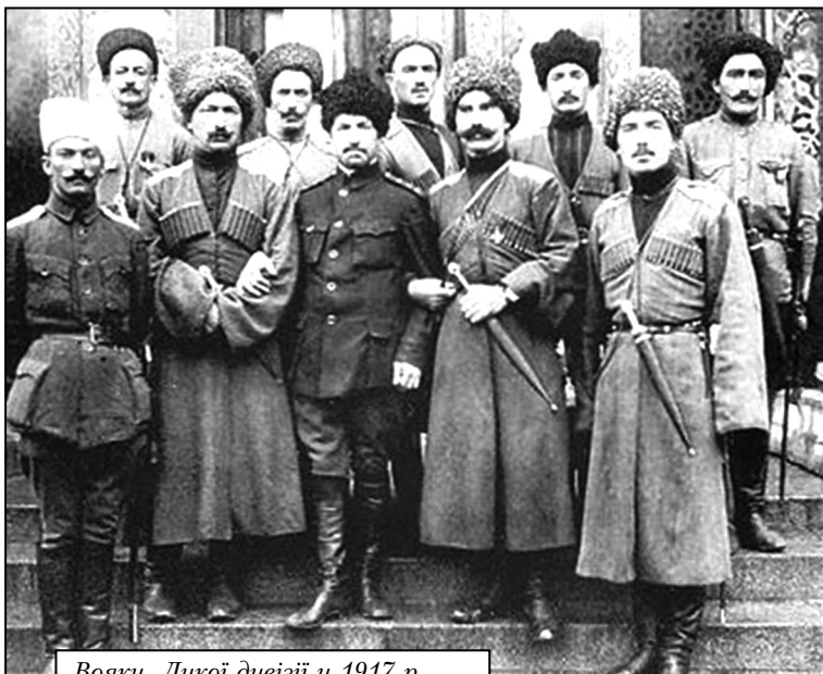
Вояки Дикої дивізії у 1917 р.

Процес створення цих формувань, що розпочався у вересні 1917 року, отримав назву «мусульманізації» та «татаризації» (утворення татарських військових частин).