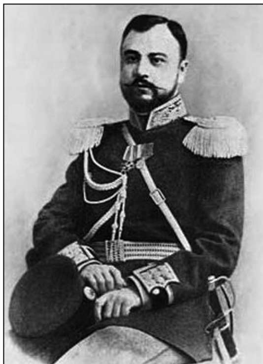
Командир 1-го Мусульманського корпусу генерал-лейтенант М. Сулькевич

У процесі розбудови власної армії Мусвиконком міг розраховувати на Кримський