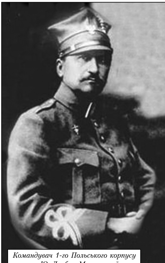
Командувач 1-го Польського корпусу генерал Ю. Довбур-Мусницький

Важливою подією для Польських військ в Росії було прийняття частинами 1-го Польського корпусу присяги на вірність єдиної на той час влади в Польщі – Регентській ради маріонеткового Польського королівства.