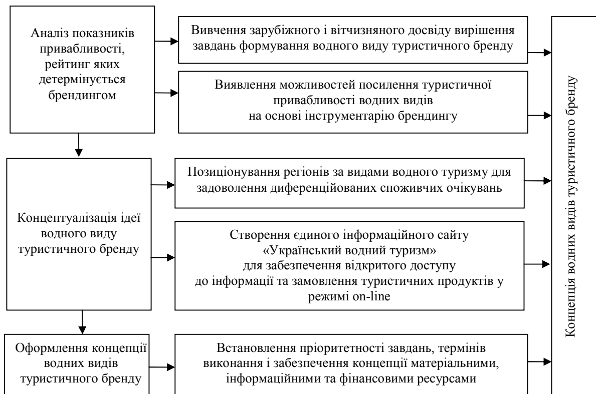
Рисунок 2 – Розробка концепції водних видів туристичного бренду (розроблено автором)

Процес формування водних видів туристичного бренду повинен регулюватися як державними, так і громадськими організаціями місцевого самоврядування, на які покладена функція розроблення туристичної політики. Туристичний бренд формується упродовж тривалого часу за принципами, які обумовлюють змістовну ідею і виступають теоретичною основою методів, що забезпечують дієвість засобів практичного застосування водних видів туристичного бренду. Розроблена концепція водних видів туристичного бренду, як багаторівневого контексту асоціативних зв'язків з національними можливостями, наведена на рис. 2.