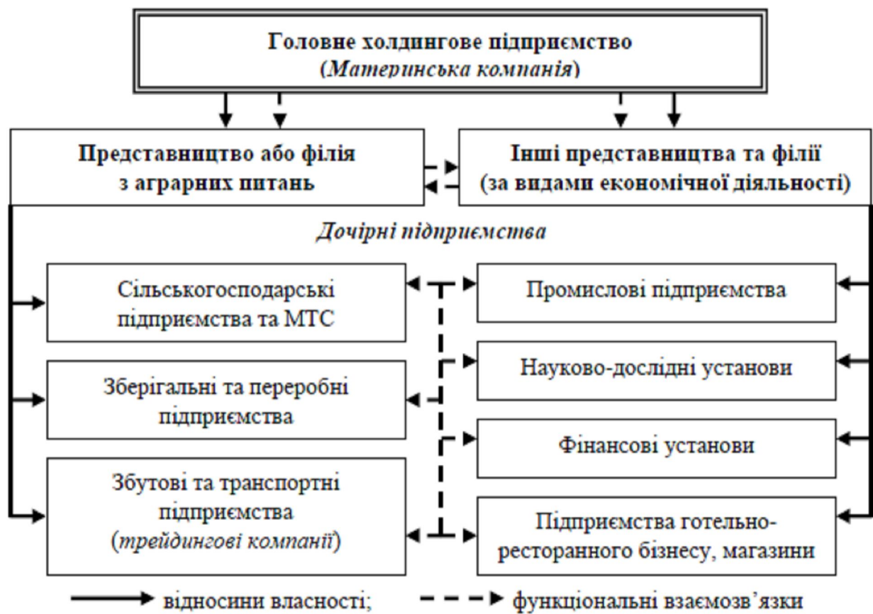
Рис. 2. Організаційна схема побудови вертикально інтегрованого підприємства холдингового типу в АПК