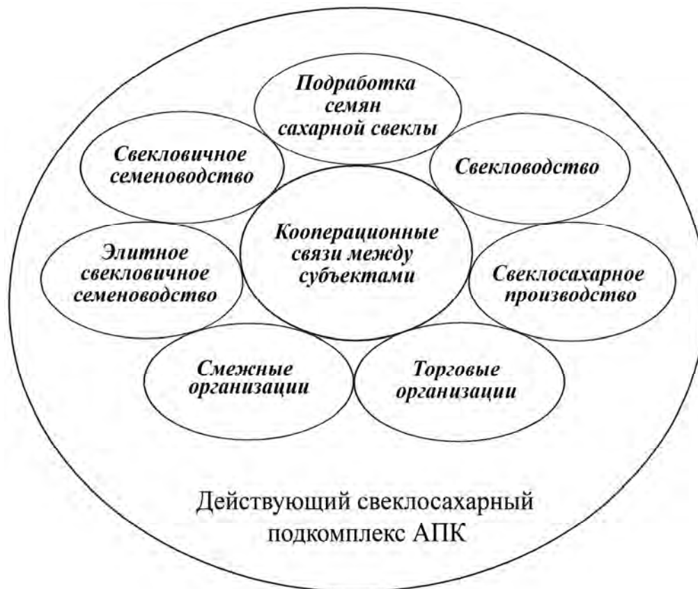
Рис. 1. Модель отсутствия синергетического эффекта в свеклосахарном подкомплексе АПК (фактическое состояние подкомплекса – несбалансированные экономические отношения)

управление синергетическими эффектами позволит решить задачу совершенствования стратегического управления развитием свеклосахарного подкомплекса АПК РФ.