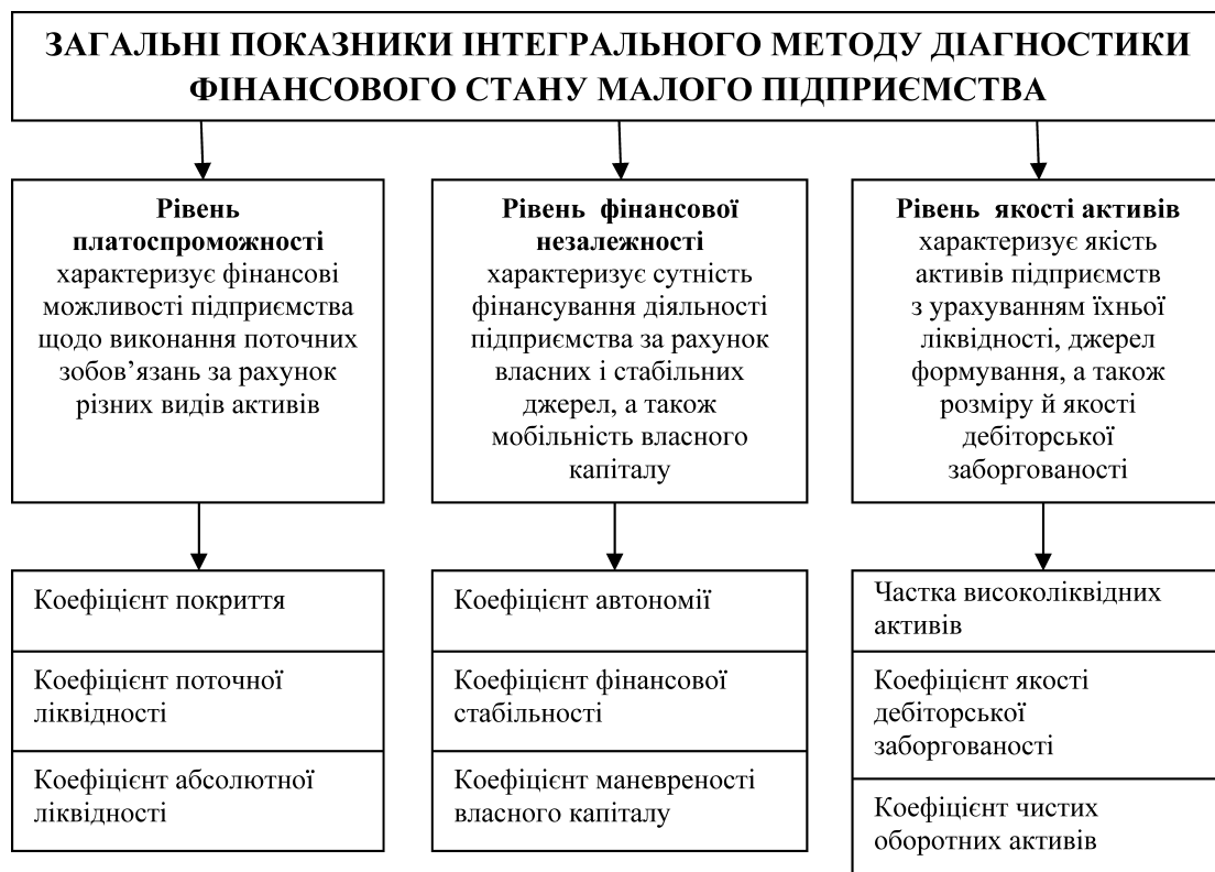
Рис. 5. Система показників інтегрального методу діагностики фінансового стану малого підприємства

Рівноважний метод діагностики фінансового стану підприємства апробований світовим досвідом. Його практична реалізація дала змогу встановити 9 типових ситуацій фінансового стану підприємства і розробити відповідні рекомендації загального характеру для досягнення фінансової рівноваги у разі відхилення підприємства від лінії рівноваги чи зони безпеки, що варто вважати дуже цінним у цьому методі. Однак і такий метод, незважаючи на всі його переваги (зручність, простота, наочність, науковість), не дає можливості врахувати стан підприємства в конкурентному, діловому, кредитному і ринковому середовищі.