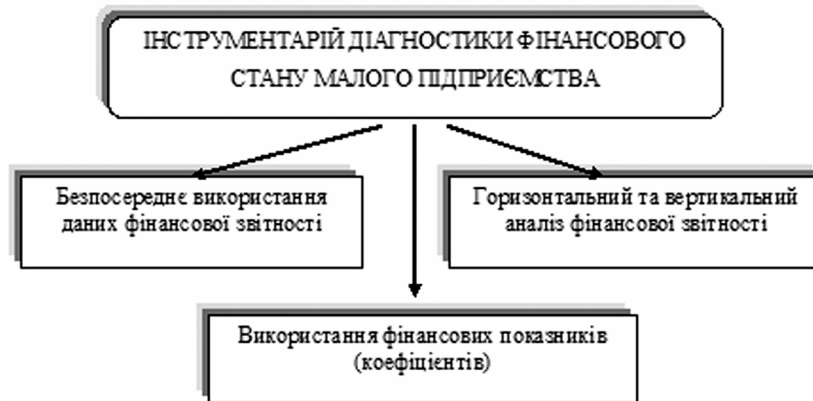
Рис. 3. Інструментарій діагностики фінансового стану малого підприємства

на перебіг фінансової кризи, розробляються заходи фінансової стабілізації малого підприємства.