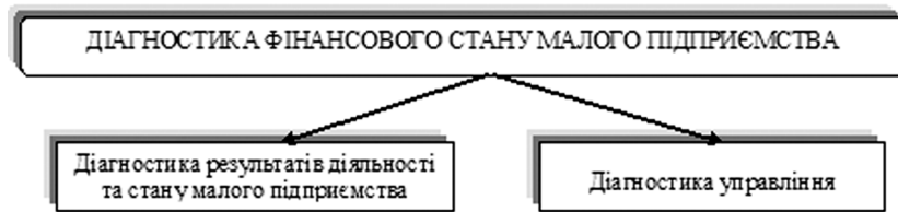
Рис. 2. Об'єкти діагностики фінансового стану малого підприємства