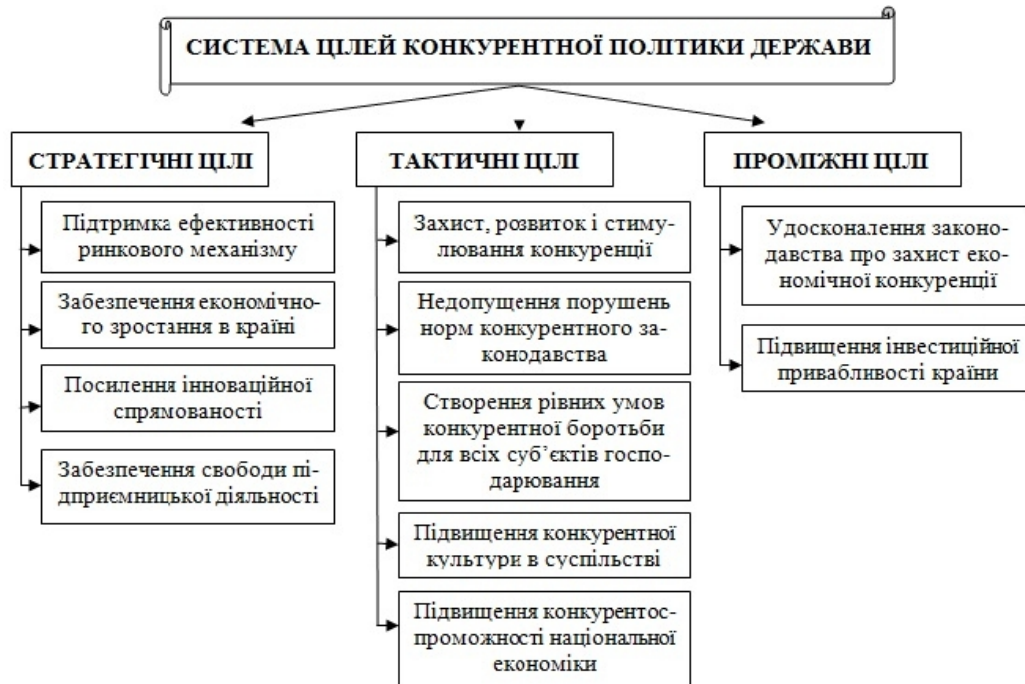
Рисунок 1 – Система цілей конкурентної політики держави [4, с. 30–31]

Структура припинених порушень органами АМКУ має тенденцію змінюватись із року в рік, що зумовлено особливістю політичної ситуації в країні та кон'юнктурою товарних ринків.