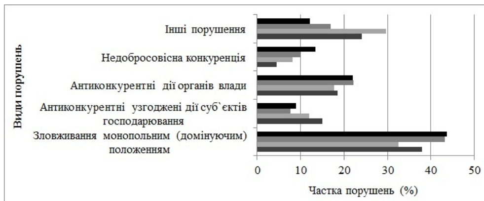
Рисунок 2 – Структура порушень законодавства про захист економічної конкуренції за 2009–2012 рр. (розраховано на основі даних АМКУ, [3])

Відрізняється й характер розвитку конкурентних відносин між учасниками вітчизняних ринків товарів та послуг залежно від техніко-економічних особливостей функціонування галузей. Необхідно звернути увагу на те, що у структурі порушень конкурентного законодавства протягом 2009–2012 рр. найбільшу частку займає зловживання монопольним (домінуючим) становищем (рис. 2).