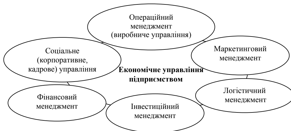
Рис. 1. Місце економічного управління в системі менеджменту

Слід зазначити, що, по-перше , графічне відокремлення на рисунку визначених видів спеціального управління не є їх вичерпним переліком. По-друге , усі визначені види спеціального управління мають зони взаємного перетину, незважаючи на те, що рисунок не віддзеркалює цей взаємозв'язок. По-третє , порядок наведення видів спеціального управління на рисунку не має за мету визначення їх ієрархії (значимості).