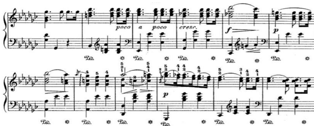
Рисунок 5. Вальс соль-бемоль мажор оп. 70 №1 (фрагмент)

У хореографічному малюнку балетної інтерпретації Вальсу підкреслюється, переважно, чотиритактова пульсація ритмічного розрізу музичної фактури. Однак, використовується також і більша періодичність пульсації ритму. Це восьмитактова структура музичного квадрата, яка ще має назву «період». У середньому розділі п'єси кілька разів звучить період, який має динамічну кульмінацію (Рис. 5).