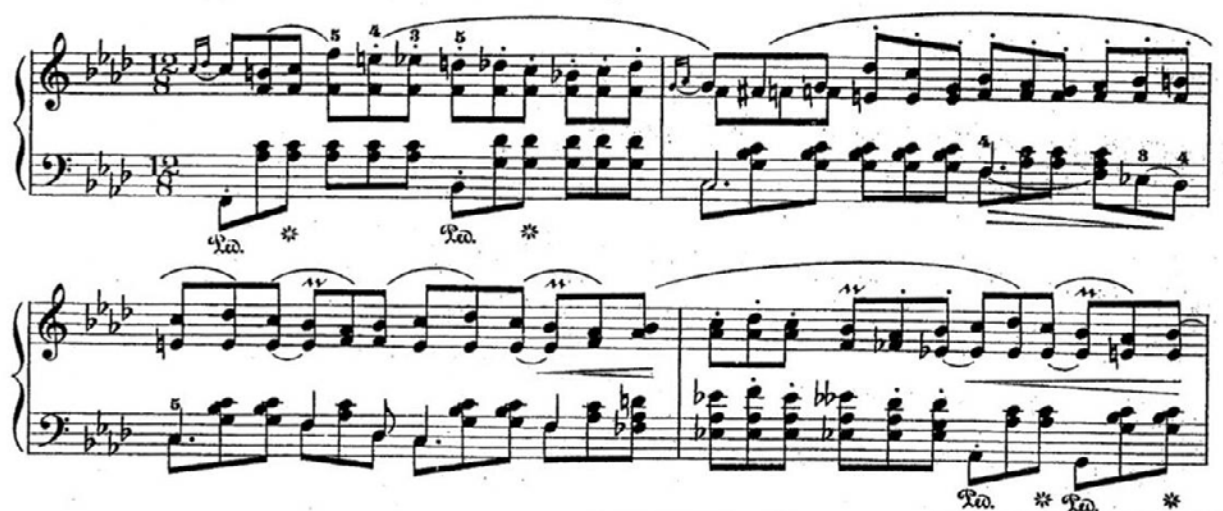
Рисунок 2. Шопен Ф. Ноктюрн ля-бемоль мажор оп. 32 №2 (фрагмент)

У середньому розділі Ноктюрна ритм мелодії повністю «зростається» з акомпанементом. Дрібніший метр створює відчуття прискорення музичного часу. Змінюється також періодичність басових нот. Усі елементи фактури підкреслюють збуджену пульсацію 8-х тривалостей (Рис. 2.).