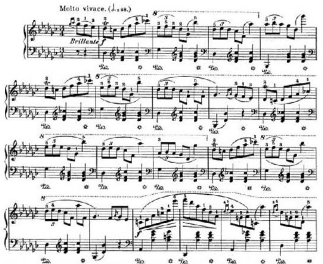
Рисунок 4. Шопен Ф. Вальс соль-бемоль мажор оп. 70 №1 (фрагмент)

Так, у постановках Фокіна ми бачимо безліч прикладів пульсації ритму різних рівнів, яка знайшла своє відображення в хореографії. Наприклад, у музичній фактурі Вальсу соль-бемоль мажор тв.70 №1 можна «прочитати» кілька ритмічних розрізів періодичності музичної будови. Це так звані музичні квадрати, тобто структура, яка виникає завдяки постійній зміні сильного і слабого тактів (Холопов, 2014, с. 281-282). Це структура європейської музики, при якій кількість тактів в кожній пропозиції та в кожному періоді дорівнює ступеню числа 2 (4,8,16 і т.д.) (Рис. 4).