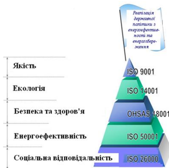
Рис. 2. Інструменти (системи менеджменту), які сприяють підтримці конкурентоспроможності ВНЗ

Основні результати дослідження. Інтегрована система менеджменту – це сукупність кількох міжнародних стандартів у рамках однієї системи. За іншим визначенням, під інтегрованою системою менеджменту розуміється частина загальної системи менеджменту підприємства, організації чи установи (далі – організації), що відповідає вимогам двох чи більше стандартів на системи менеджменту, яка функціонує як єдине ціле і спрямована на задоволення зацікавлених сторін [4].