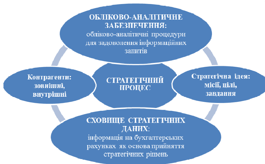
Рис.1. Обліково-аналітичне забезпечення в системі моделювання досягнення стратегічних цілей підприємства

Виходячи з наведеного, побудуємо модель стратегічного процесу у контексті визначення ролі обліково-аналітичного забезпечення як інструменту моделювання досягнення стратегічних цілей (рис.1).