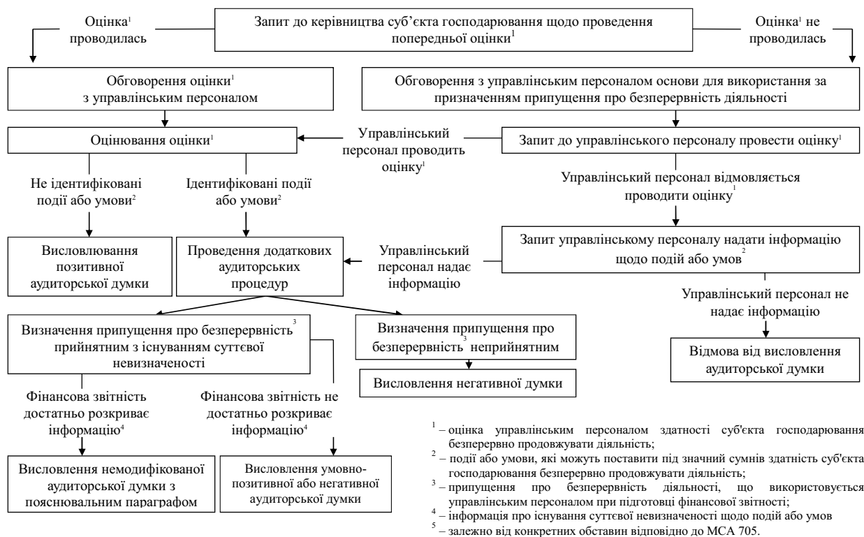
Рис. 2. Послідовність аудиту дотримання принципу безперервності