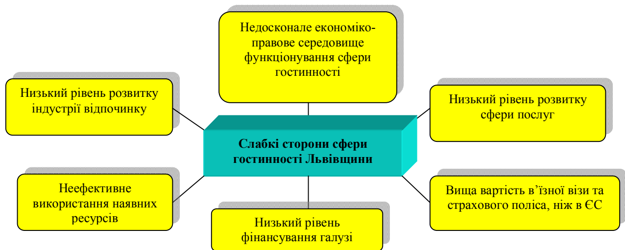
Рис. 3. Слабкі сторони сфери гостинності Львівщини

- залучення зовнішніх інвестицій до реалізації програми регіонального розвитку, окремих проєктів, що входять до її складу, зокрема на розвиток інфраструктури для обслуговування рекреаційних потоків, – транспорт, торгівлю, зв'язок, виробництво продукції для використання у курортно-рекреаційній діяльності і сфері послуг [15, с. 1050];