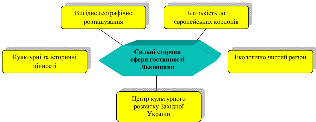
Рис. 2. Сильні сторони сфери гостинності Львівщини

- комплексний підхід до підвищення якості прийому туристів та сервісного обслуговування;