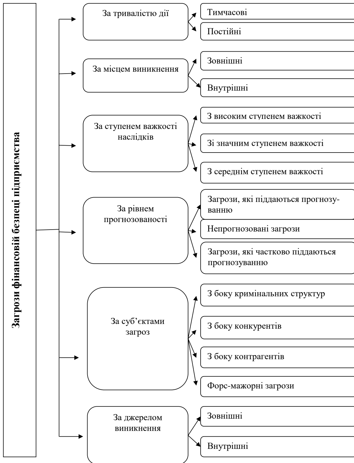
Рис.2. Основні типи загроз фінансовій безпеці підприємства [2,с. 34]

Залежно від суб'єктної обумовленості негативні впливи на економічну безпеку можуть мати об'єктивний і суб'єктивний характер. Об'єктивними вважаються такі негативні впливи, які виникають не з волі конкретного підприємства або його окремих працівників. Суб'єктивні впливи виникають внаслідок неефективної роботи підприємства в цілому або окремих його працівників (передусім керівників і функціональних менеджерів) [1, с. 100-101].