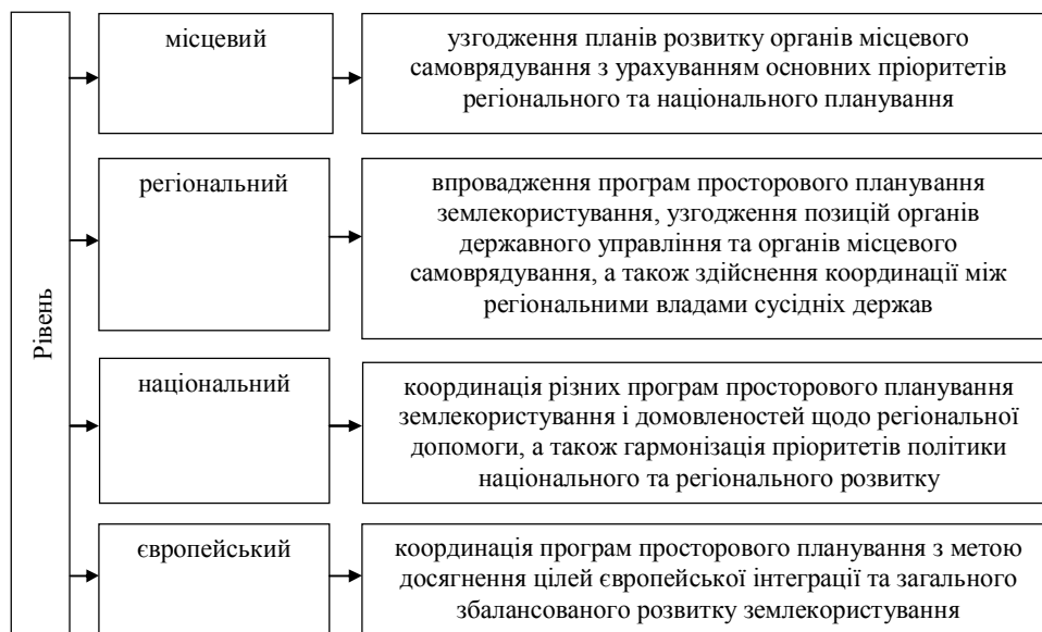
Рис. 2. Рівні прийняття рішень з просторового планування землекористування в країнах ЄС