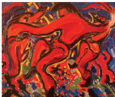
Іл. 5. Е. Нольде «Танці навколо золотого тільця» (1910) М. Демцю «Аркан» (2009)