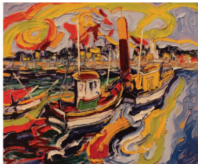
М. Демцю «Вид на Лоріон. Франція» (2007)