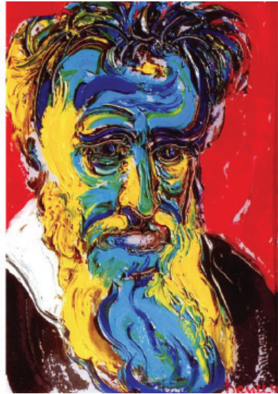
М. Демцю «Митрополит» (2002).