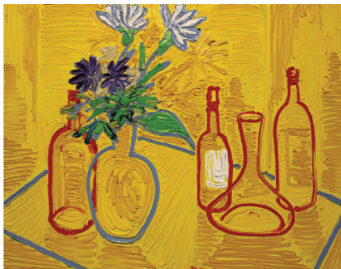
Іл. 3. Г. Мюнтер «Жовтий натюрморт» (1909) М. Демцю «Натюрморт» (2015)