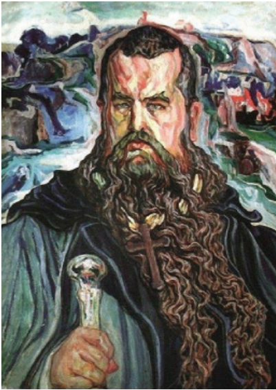
Іл. 1. О. Новаківський «Мойсей (Портрет Андрея Шептицького)» (1915-1919)