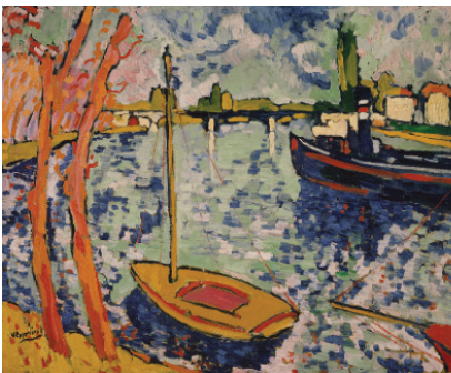
Іл. 2. М. де Вламінк «Річка Сена в Шату» (1906)