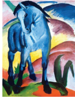
Іл. 7. Ф. Марка «Синій кінь I» (2011) М. Демцю «Молодий кінь» (2016)