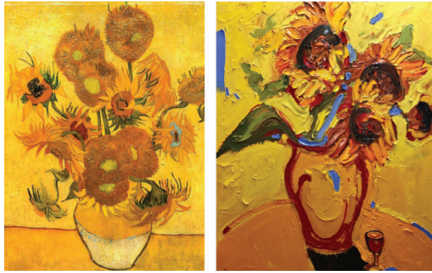
Іл. 6. В. Ван Гога «Соняшники» (1888) М. Демцю «Квіти сонця» (2011)