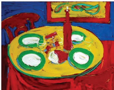
Іл. 4. Р. Дюфі «Інтер'єр з фруктами в вазі» (1908) М. Демцю «Запрошення до розмови» (2002)