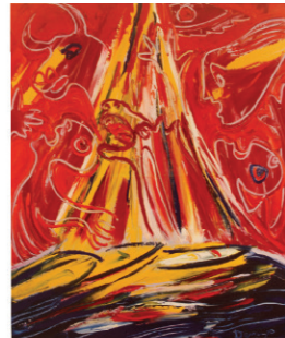
Іл. 8. П. Пікассо «Герніка» (1937) М. Демцю «Із серії зустрічі з Пікассо» (2010)