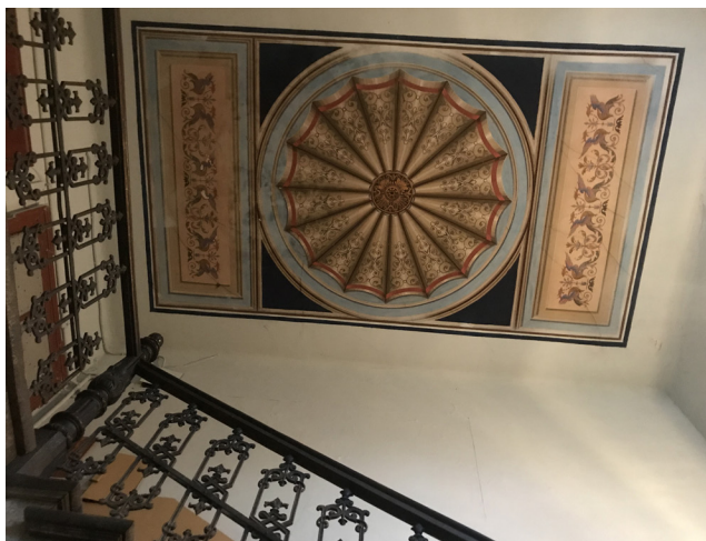
Іл. 8. Художній розпис в стилістиці ампіру. м. Львів, вул. К. Левицького, 7