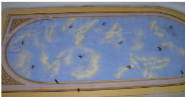
Іл. 4. Художній розпис в стилістиці необароко. м. Львів, вул. А. Чехова, 28