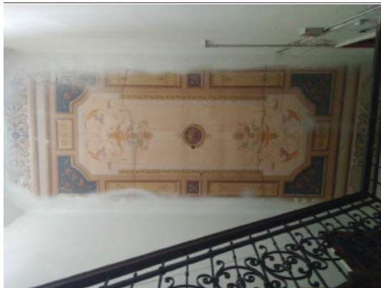
Іл. 3. Художній розпис в стилістиці неоренесансу. м. Львів, вул. І. Франка, 40