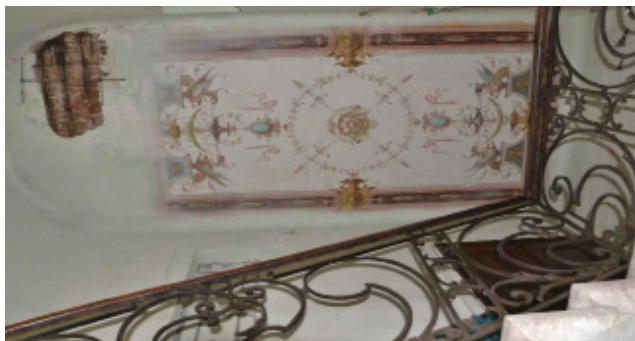
Іл. 1. Художній розпис в стилістиці неоренесансу. м. Львів, вул. Пекарська, 48

Key words: mural paintings, interior design, entrance space, living architecture, residential buildings, synthesis of art