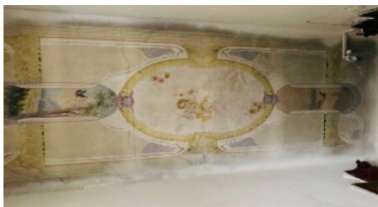
Іл. 5. Художній розпис в стилістиці необароко. м. Львів, вул. акад. М. Кравчука, 10