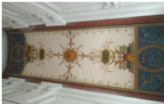
Іл. 2. Художній розпис в стилістиці неоренесансу. м. Львів, вул. Л. Глібова, 15