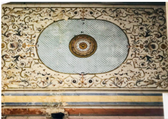
Іл. 6. Художній розпис в стилістиці необароко. м. Івано-Франківськ, вул. акад. Січових Стрільців, 10