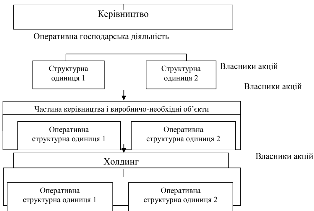
Рис. 2. Поділ холдингу відділенням частки самостійного господарського товариства.

Висновки. На основі проведеного дослідження можемо стверджувати, що виникнення та розвиток агрохолдингів – це результат здійснення аграрної реформи. Їх вплив на підвищення ефективності використання виробничих ресурсів у сільському господарстві та інших сферах агробізнесу варто оцінювати позитивно. Їх роль у діяльності АПК України на сьогодні значна й зростатиме в майбутньому. Триватиме процес концентрації землі сільськогосподарського призначення агрохолдингами через її оренду та банкрутство неефективних сільськогосподарських підприємств. У такій ситуації роль держави полягає в