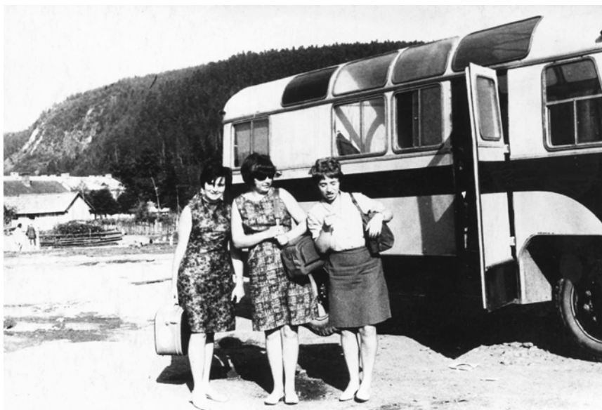
Фото 5. Студентки Львівської консерваторії – учасниці музично-етнографічної експедиції у селі Тухолька Сколівського району Львівської області. Експедиція Консерваторії № 19 (1 сеанс). 1967 рік.

Також завдяки В. Гошовському в середині 1960-х років Кабінет налагодив стосунки із подібними закладами Мінська, Вільнюса, Москви, Братислави, Брно, Будапешта та Варшави [2, с. 369].