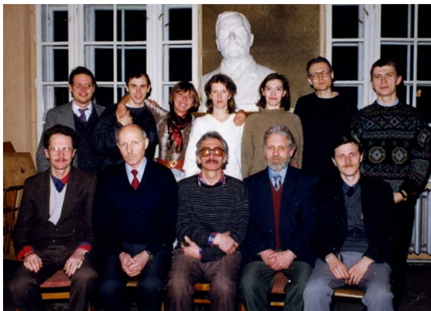
Фото 10. Працівники ПНДЛМЕ та Кафедри музичної фольклористики.

вача та 3-х старших лаборантів (двох лаборантів із вищою освітою та однієї без) 1 . У грудні того ж року в Консерваторії була заснована одна з перших у Східній Європі кафедр музичної фольклористики 2 . Тоді ж Л. Кушлика, який став старшим викладачем цієї кафедри, на посаді завідувача Лабораторії змінив Тарас Брилинський [37]. У грудні 1992 року наказом Міністерства культури України була створена Проблемна науково-дослідна лабораторія музичної етнології [34].