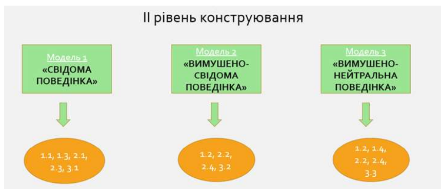
Рис. 1.2. «Дискурси та їх ймовірний вплив на формування моделей поведінки»

Як відомо, дискурси конструюються, у цьому випадку – низкою інституцій: влада (президент, уряд), Міністерство охорони здоров’я України, лідери думок, засоби масової інформації (телебачення), громадська думка та ін. Таким чином створюється перший рівень конструювання дискурсів у свідомості населення – це один із способів, шляхом якого об’єктивна дійсність пропонується до сприйняття та виражається у суб’єктивних судженнях. Оскільки дискурси мають безпосередній зв’язок із поведінкою та подальшими діями індивідів, то можна стверджувати, що конструюючи ці дискурси та розповсюджуючи їх в українському дискурсивному полі, інституції звершують маніпулятивний вплив шляхом зміни поведінки індивідів задля досягнення власних цілей.