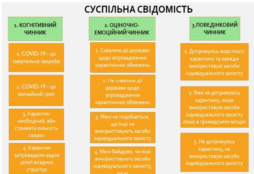
Рис. 1.1. «Дискурси та їх ймовірний вплив на формування моделей поведінки»