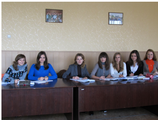
Учасники опитування “Ієрархія цінностей”

Аналіз діяльності наукового товариства академії свідчить про позитивну динаміку рівня обґрунтованості наукових результатів та їх новизни. Зокрема, упродовж вересня-грудня 2012 року наукове товариство кафедри соціально-економічних дисциплін здійснило анкетування, інтерв'ю і співбесіди серед курсантської та студентської молоді. Майбутні фахівці з великою зацікавленістю поставились до пропозиції щодо створення спільними зусиллями “портрета сучасного студента”. Результати дослідження відображено у [12].