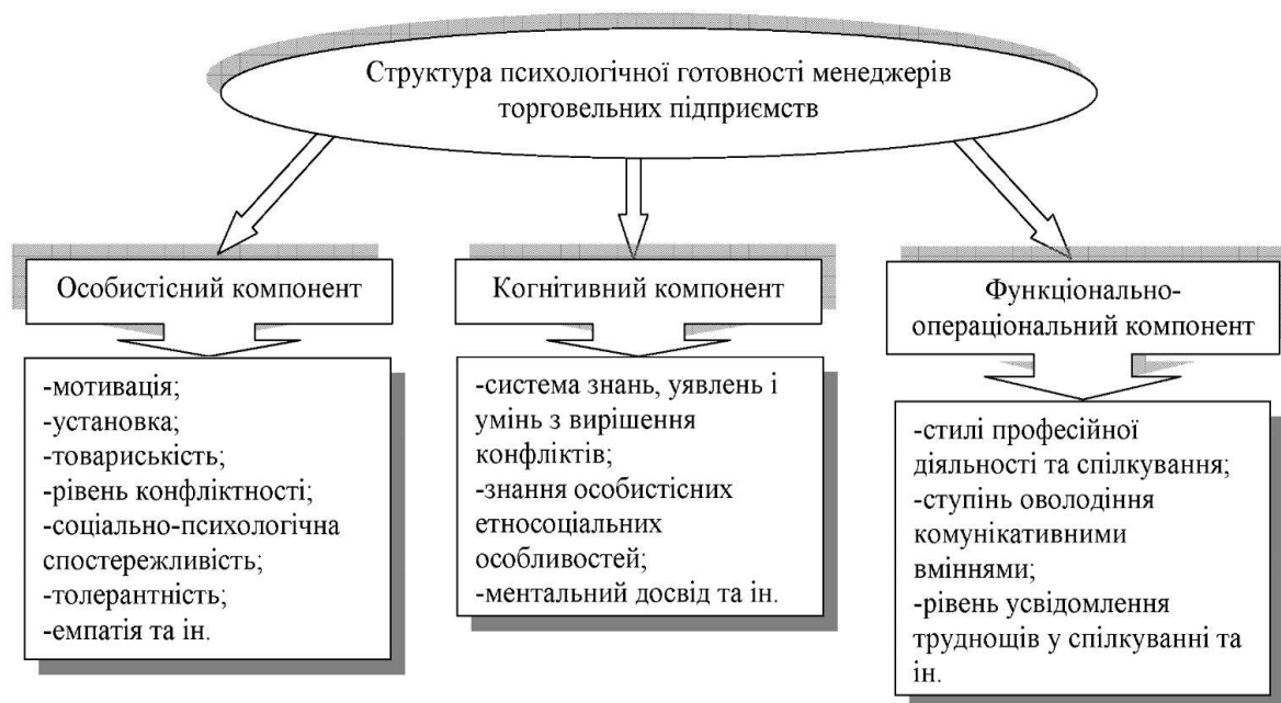
Рис.2. Структура психологічної готовності менеджерів підприємств

Таким чином, соціально-психологічна готовність менеджерів підприємств має складну багатофункціональну структуру і складається з трьох основних компонентів: особистісних якостей, когнітивного та функціонально-операціонального компоненту. Більш детально див. на рис.2.