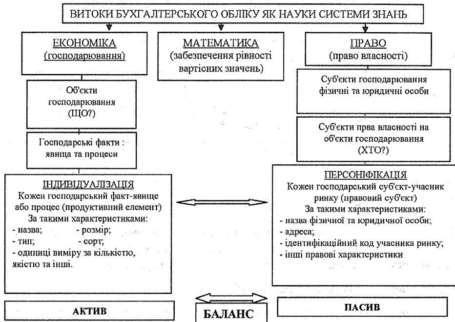
Рис. 1. Бухгалтерський облік як система знань

Визначаючи об'єкти обліку в управлінні підприємством, змістовний характер господарських фактів (явищ і процесів), взаємозв'язок об'єктів обліку на підставі теорії двоїстості, характер об'єкта з економіко-правовими характеристиками; складати будь-яке бухгалтерське проведення фінансового характеру, виконувати записи вручну та за допомогою технічних засобів (ЕОМ). Складати документи, тлумачити закони, що стосуються фінансового обліку, складати розрахунки та алгоритми їх розв'язування на ЕОМ.