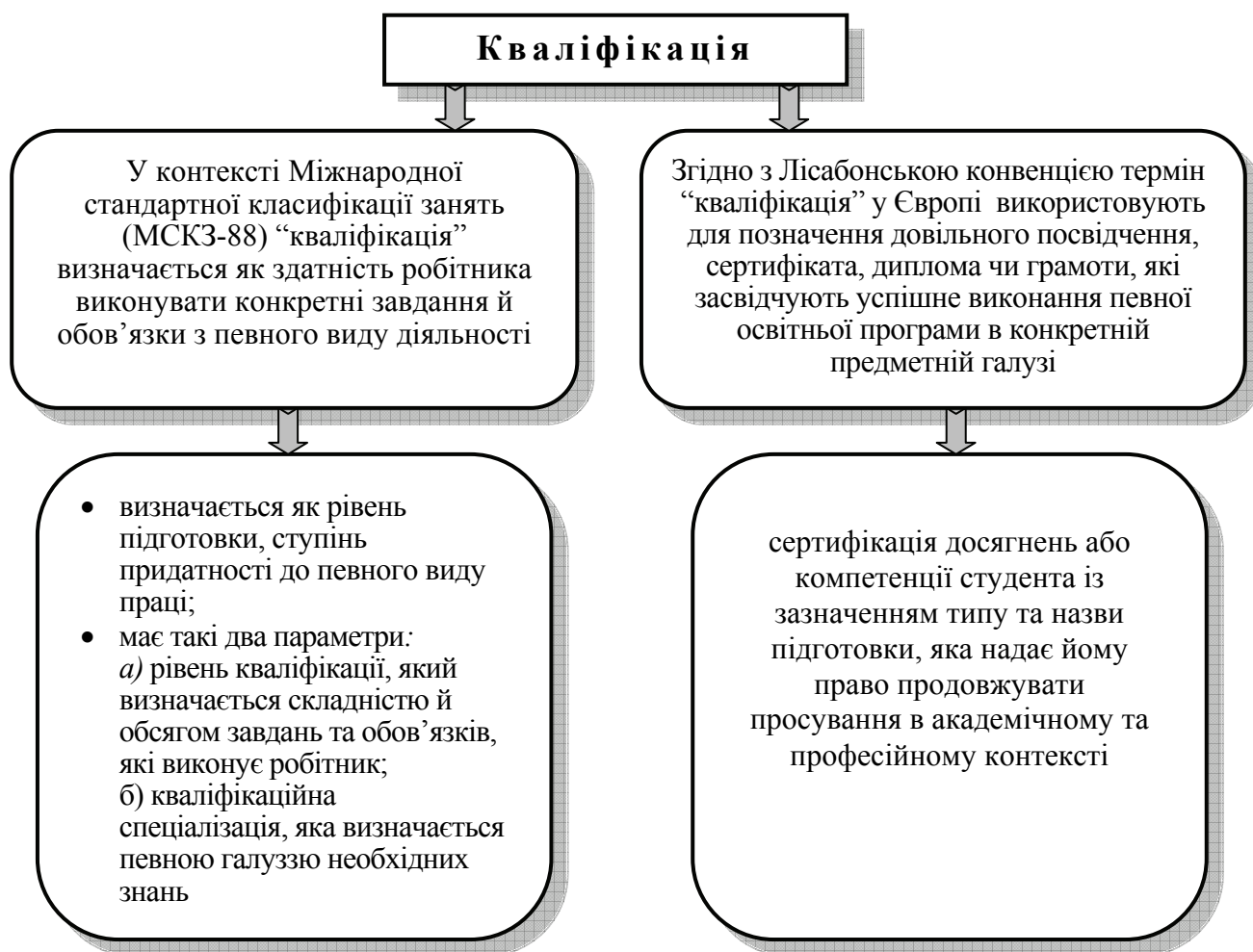
Рисунок 4 – Зміст поняття “кваліфікація”

Тут важливо уявити розбіжності між змістом поняття “кваліфікація”, наданого в контексті Міжнародної стандартної класифікації занять і Лісабонської Конвенції про визнання кваліфікацій (1997) (див. рис. 4).