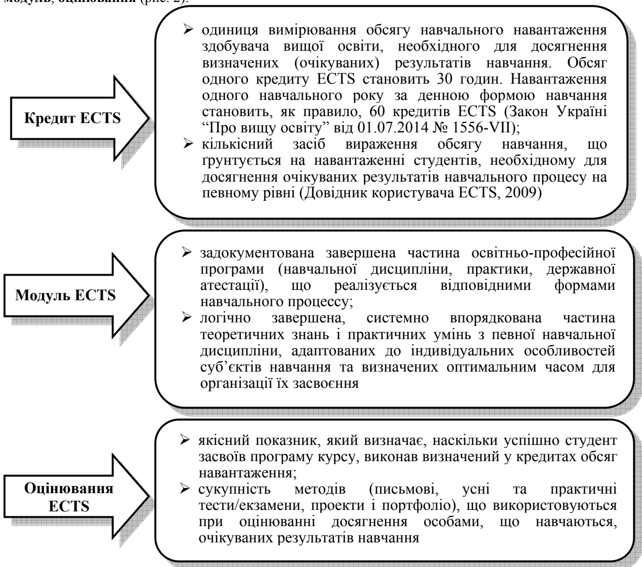
Рисунок 2 – Складові ECTS

Отже, як система організації навчального процесу ECTS вміщує основні три складові: кредит, модуль, оцінювання (рис. 2).