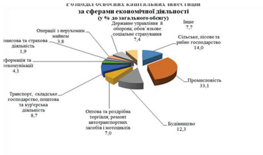
Рисунок 5 – Розподіл освоєних капітальних інвестицій за видами економічної діяльності, (у % до загального обсягу)