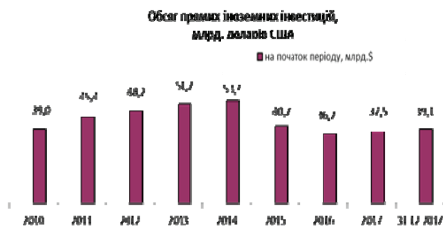
Рисунок 3 – Обсяг прямих іноземних інвестицій, млрд. дол. США Figure 3 – Volume of direct foreign investments, bn. USD

Інвестиції спрямовуються у вже розвинені сфери економічної діяльності.