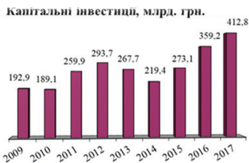
Рисунок 4 – Капітальні інвестиції, млрд. грн. Figure 4 – Capital Investments, bln. UAH

Обсяги освоєння капітальних інвестицій підприємств України у 2017 році складають 412,8 млрд. грн., що на 22,1 % більше від обсягу капітальних інвестицій за відповідний період 2016 року (Рис. 4). У січні – березні 2018 року – 89,0 млрд. грн., що на 37,4 % більше від обсягу капітальних інвестицій за відповідний період 2017 року.