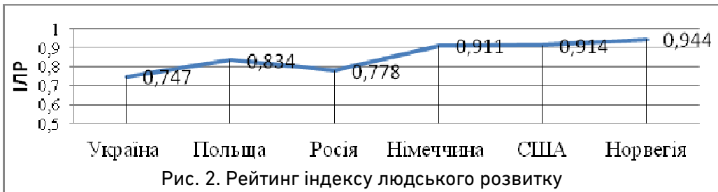
Рис. 2. Рейтинг індексу людського розвитку деяких країнах світу за 2014 рік

Згідно даних Доповідей про людський розвиток з 2010 по 2015, позицію лідера серед 187 країн світу тримає Норвегія. У першу десятку країн-лідерів з дуже високим рівнем розвитку увійшли: Австралія, Швейцарія, Данія, Нідерланди, Німеччина, Ірландія, Сполучені Штати Америки, Канада, Нова Зеландія.