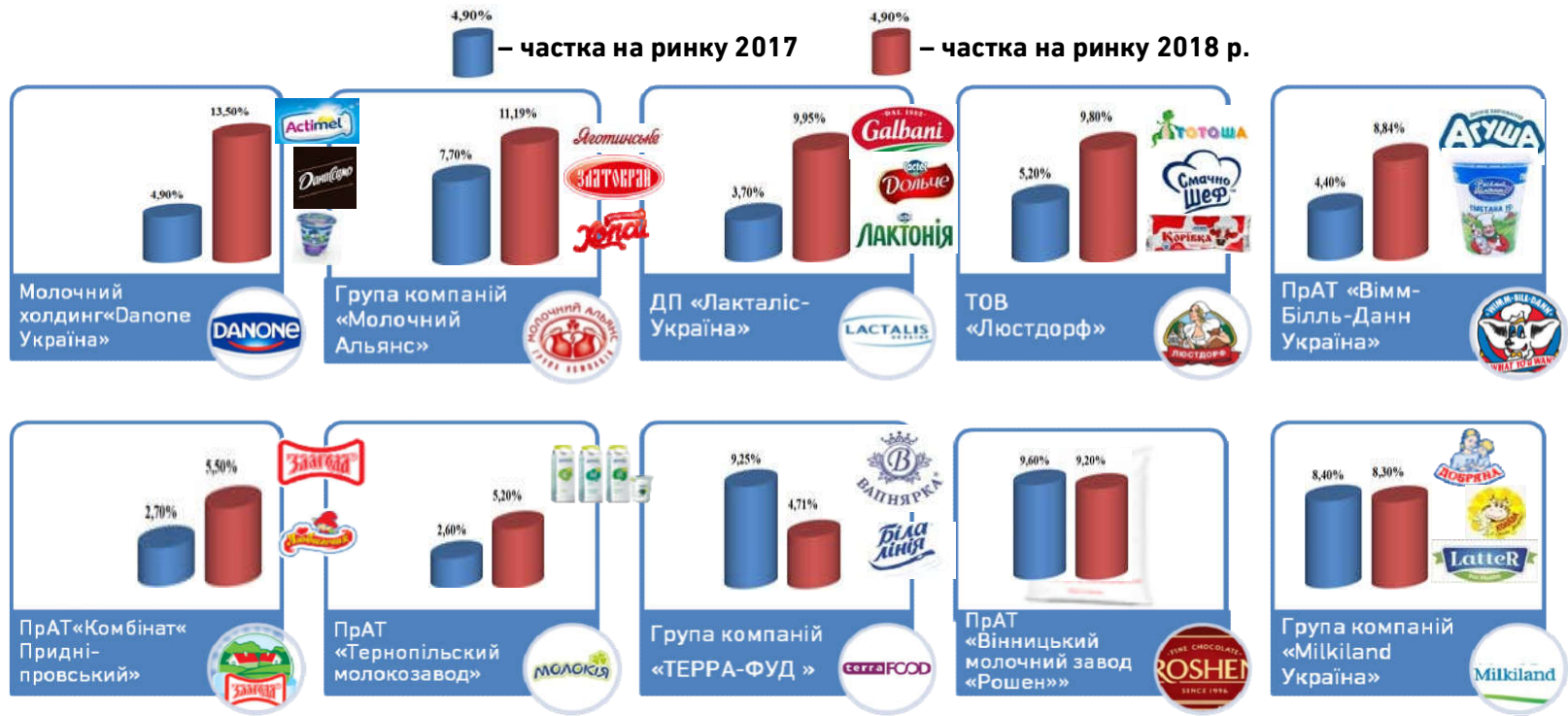
Рис. 2. Торгові марки провідних операторів вітчизняного ринку молока та молочної продукції