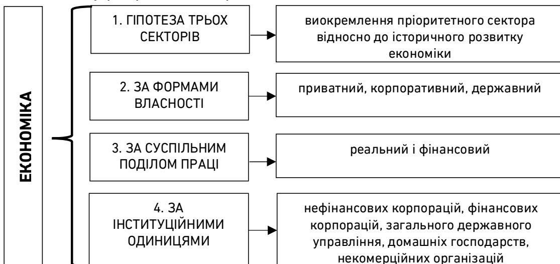
Рис. 1. Методичні підходи щодо структуризації економіки у секторальному розрізі (розроблено автором)

На рис. 1 подано методологічні підходи щодо структурування економіки у розрізі її секторів.